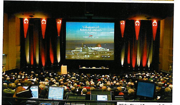
Wisby Strand Congress & Event

GOLFPAKET: 1595 kronor (logi, greenfee, frukost, tvårättersmiddag). Stort utbud av golfskolor och tävlingsarrangemang. www.knistad.se , 0500-499000